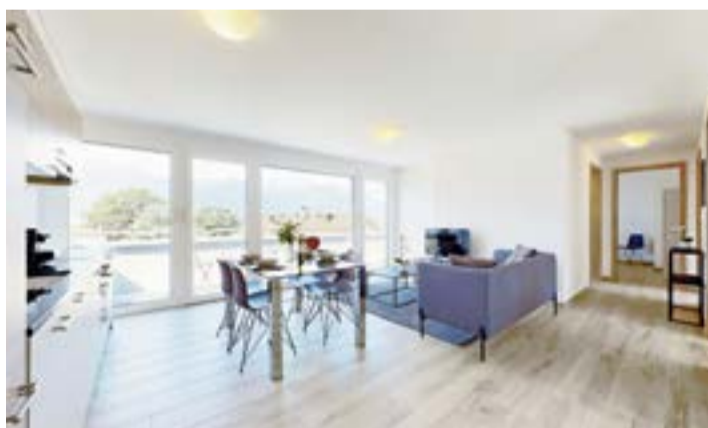
Un des appartements de la résidence hôtelière du Chablais.

Le Swiss Resort propose 40 studios et 16 appartements à Aigle. Le prix de location oscille entre 60 et 120 francs en courte durée et entre 1350 et 1750 francs pour une location mensuelle avec service. L'établissement n'a pas encore été classifié par HôtellerieSuisse mais vise les 3 étoiles. Un restaurant, géré indépendamment, doit ouvrir dans le courant de 2021. Le coût global de la réalisation est de 10 millions de francs investis par le propriétaire, le groupe Mutuel. cj